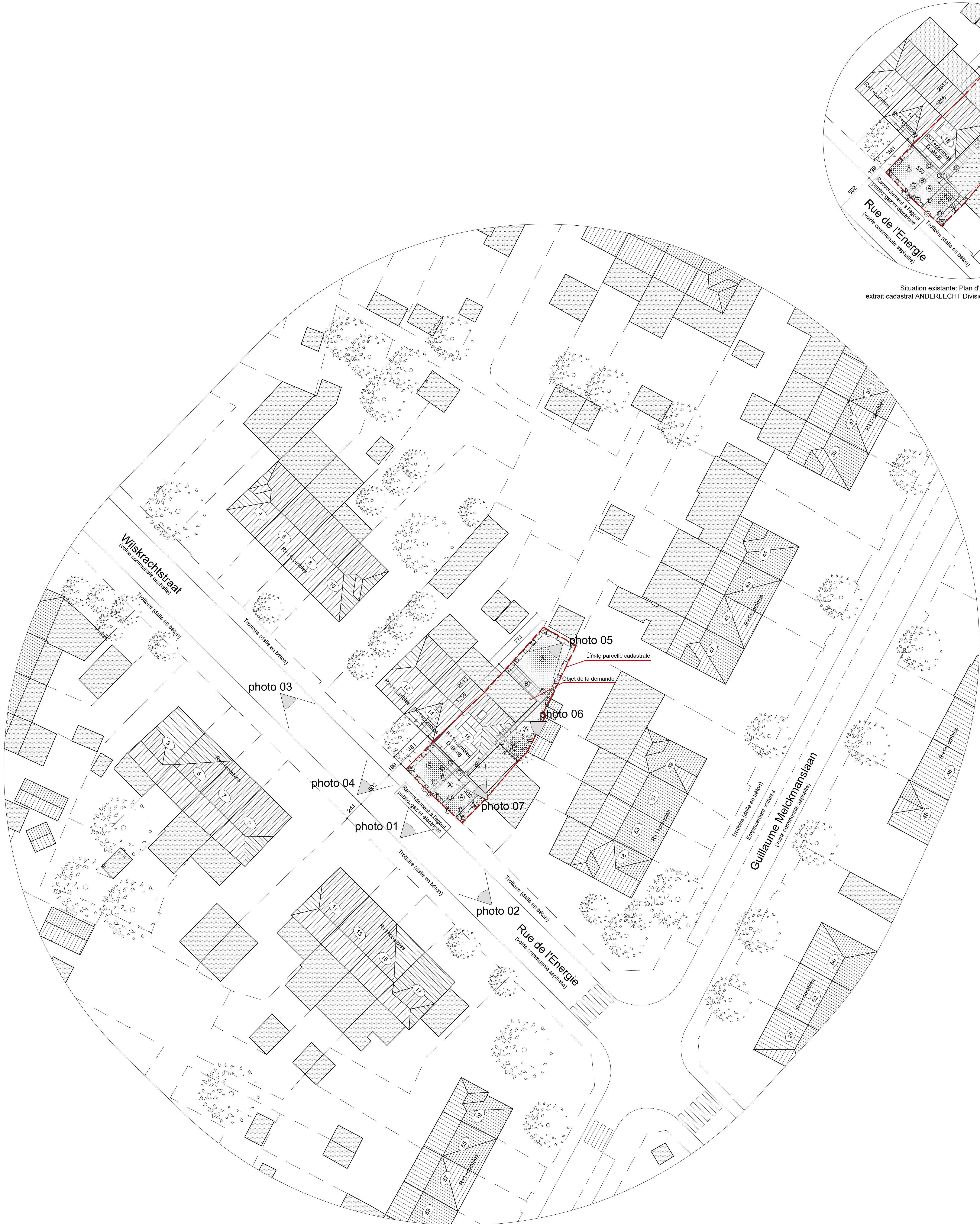
Situation existante: Plan d'implantation extrait cadastral ANDERLECHT Division 6 Section D n°196d6